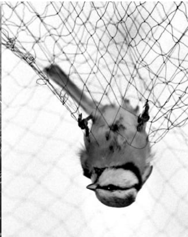
Vi bekantade oss snabbt med blåmesar som hösten 1965 förekom invasionsartat. Märksiffran för året blev 855 individer.