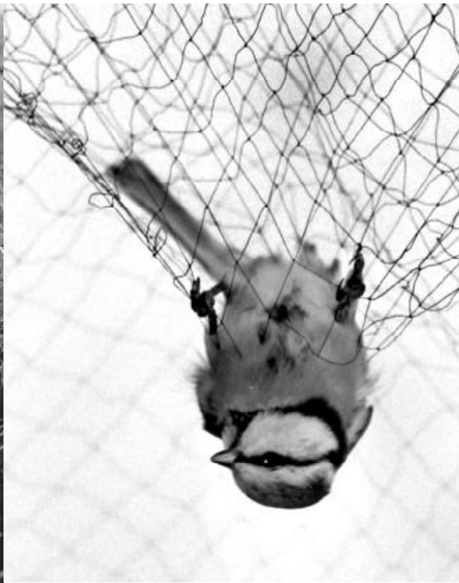
Vi bekantade oss snabbt med blåmesar som hösten 1965 förekom invasionsartat. Märksiffran för året blev 855 individer.