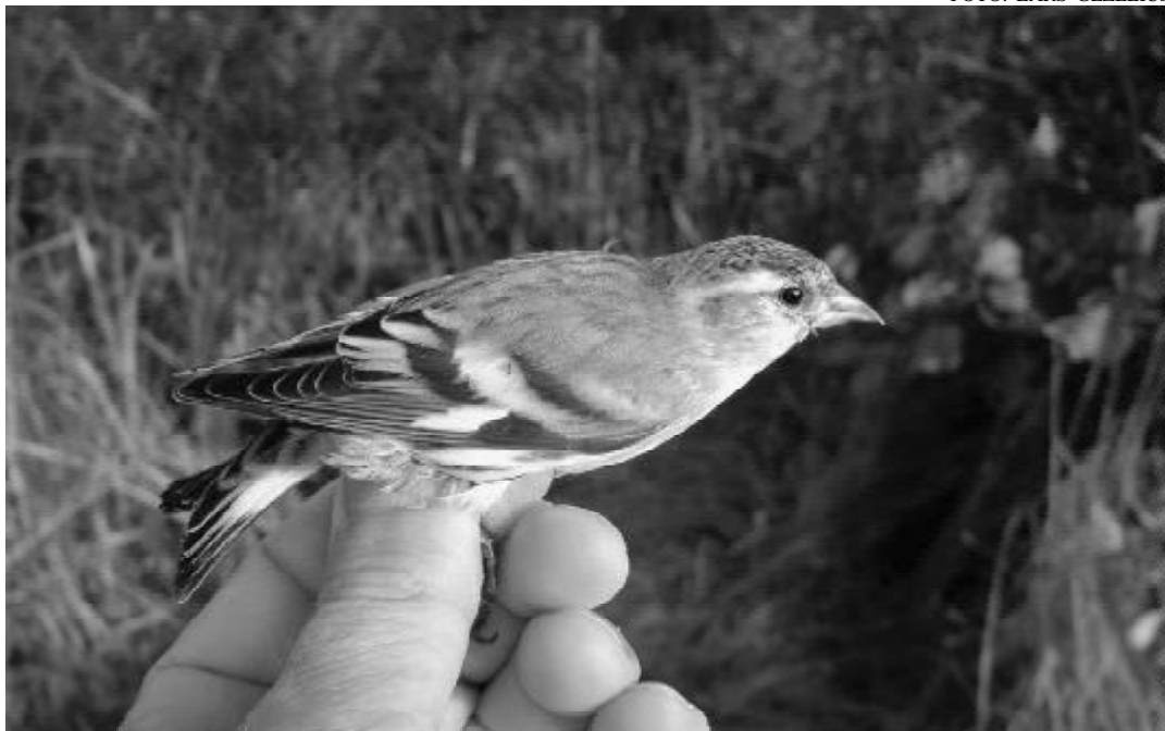
69 grönsiskor ringmärktes under 2004.