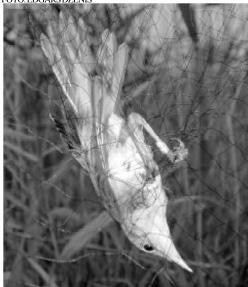
Rörsångare i nätmaskorna.