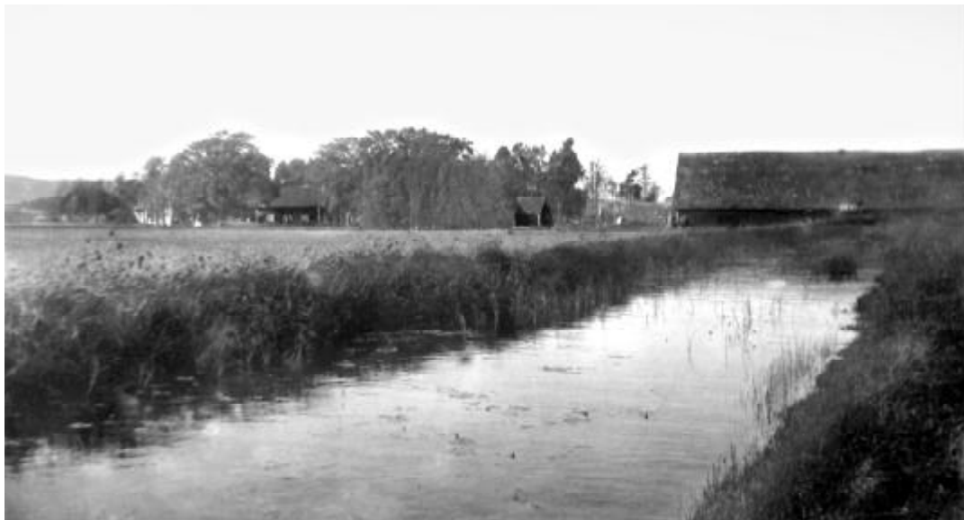
Kvarnstugan med tillhörande bod och kvarnlada som det såg ut för ca 100 år sedan. Kvarnstugan till vänster som troligen är byggd omkring 1850.