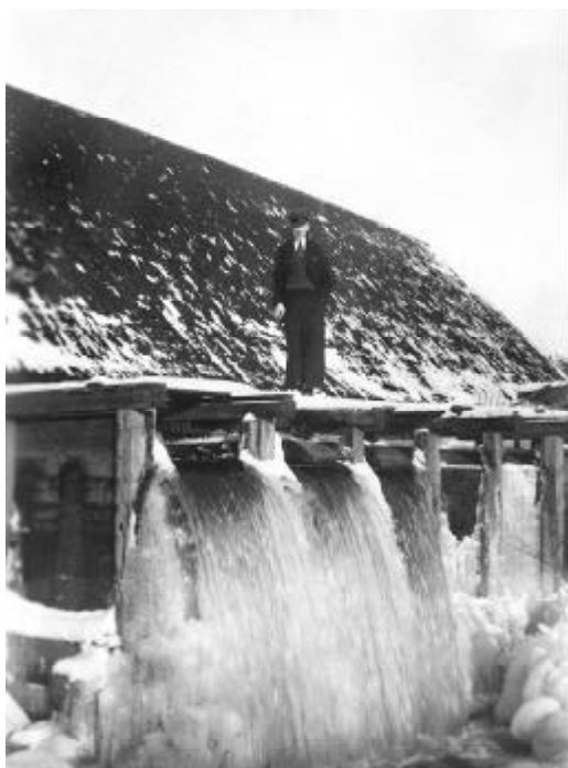
Ramstad vattenfall, strax norr om ladan. Fallhöjd över två meter! Inne i ladan fanns en kvarn. Ladan revs omkring 1940.